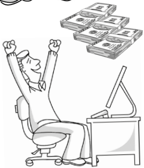
Nach einer Glückssträhne ...